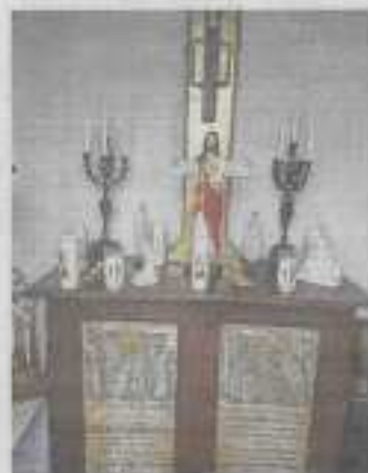
L'intérieur de la chapelle, un lieu de culte prisé aussi par les touristes.